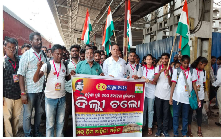
ଓଡ଼ିଶାକୁ ଅବହେଳା ପ୍ରତିବାଦରେ ଆକାଦ ହିନ୍ଦ୍ ବାହିନୀର ବିଲ୍ଲୀ ଚଲୋ ଡାକରା

ଓସିଙ୍ଗଟନ ଡିସି: ଚୀନକୁ ଖୋଲା ଧମକ ଦେଲେ ଆମେରିକା ରାଷ୍ଟ୍ରପତି ଡୋନାଲ୍ଡ ଟ୍ରମ୍ପ । ଚୀନ ଉପରେ ଅତିରିକ୍ତ ୫୦ ପ୍ରତିଶତ ଚାରିଫ୍ ଲଗାଇବା ଆମେରିକା । ୩୪ ପ୍ରତିଶତ ଚାରିଫ୍ ନ ଓହରିଲେ ୫୦ ପ୍ରତିଶତ ଲଗାଇବାକୁ ଖୁଲମଖୁଲା ଧମକ ଦେଉଛନ୍ତି ଟ୍ରମ୍ପ । ତେବେ ବିଶ୍ୱରେ ଚାରିଫ୍ କୁ ନେଇ ଯୁଦ୍ଧ ସ୍ଥିତି ଉପସ୍ଥିତ ହେବା ବେଳେ ଚୀନ-ଆମେରିକା ମୁହାଁମୁହିଁ ହୋଇଛନ୍ତି । ବେଜିଂ ଆମେରିକା ଉପରେ ୩୪ ପ୍ରତିଶତ ଶୁଳ୍କ ଲଗାଇବା ଘୋଷଣା କରିବାର ୪୮ ଘଣ୍ଟା ନ ପୂର୍ବରୁ ଡୋନାଲ୍ଡ ଟ୍ରମ୍ପ ଚୀନ ଉପରେ ଅତିରିକ୍ତ ୫୦ ପ୍ରତିଶତ ଶୁଳ୍କ ଲଗାଇଛନ୍ତି । ଫଳରେ ଚୀନ ସାମଗ୍ରୀ ଉପରେ ଆମେରିକାର ମୋଟ ଚାରିଫ୍ ୯୪ ପ୍ରତିଶତ ଛୁଇଁଛି । ପୂର୍ବରୁ ୩୪ ପ୍ରତିଶତ ଚାରିଫ୍ ସହ ନୂଆ ୫୦ ପ୍ରତିଶତ ଏହାଛଡ଼ା ସବୁ ଦେଶ ଉପରେ ୧୦ ପ୍ରତିଶତ ଗ୍ଲୋବାଲ ଚାରିଫ୍ ମିଶାଇ ଚୀନ ଉପରେ ୯୪ ପ୍ରତିଶତ ଶୁଳ୍କ