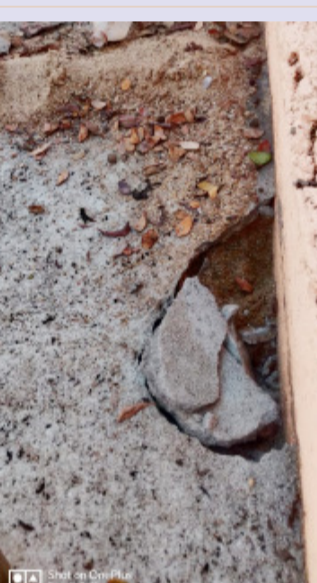
ତରଫରୁ ଚୟନ କରାଯାଇ ଠିକାଦାର ମନୋରଞ୍ଜନ କେନା କୁ କାର୍ଯ୍ୟ କରିବାପାଇଁ

ଭାସ୍କର, (ନି.ପ୍ର) : ଗ୍ରାମ୍ୟ ଉନ୍ନୟନ ବିଭାଗ କନିଷ୍ଠ ଯତ୍ନ ଏବଂ ଠିକାଦାର କ ମଧୁରାଜିକା ଯୋଗୁଁ ପ୍ରାୟ ୧.୬୦ ଲକ୍ଷ ଟଙ୍କାର କାର୍ଯ୍ୟ ଶେଷ ହେବାର ୭ ଦିନ ଭିତରେ ଭାଙ୍ଗି ଦୁରମାର । ଏହିଭଳି ନିମ୍ନମାନର କାର୍ଯ୍ୟ ଦେଖିବାକୁ ମିଳିଛି କରବର ହୋମିଓପାଥି ସ୍ଵାସ୍ଥ୍ୟ କେନ୍ଦ୍ରର ପାଚେରି ଏବଂ ଚଟାଣ ନିର୍ମାଣରେ । ଯାହାକି ଗ୍ରାମ୍ୟ ଉନ୍ନୟନ ବିଭାଗର କନିଷ୍ଠ ଯତ୍ନ ଏବଂ ସହକାରୀ ନିର୍ବାହୀ ଯତ୍ନ କ କାର୍ଯ୍ୟସମ୍ପାଦକ ପ୍ରତି ପ୍ରଶ୍ନାବତୀ ସୃଷ୍ଟି ହୋଇଛି । ଉଲ୍ଲେଖଯୋଗ୍ୟ, ଭାସ୍କର ବୁକ କରବର ଗ୍ରାମ୍ୟ ଉନ୍ନୟନ ହୋମିଓପାଥି ସ୍ଵାସ୍ଥ୍ୟକେନ୍ଦ୍ରର ପାଚେରି ଓ ଚଟାଣ କାର୍ଯ୍ୟ ମରାମତି ପାଇଁ ଗ୍ରାମ୍ୟ ଉନ୍ନୟନ ବିଭାଗ ତରଫରୁ ସ୍ଵତନ୍ତ୍ର ମରାମତି ପାଇଁ ଏକ ଲକ୍ଷ ଷାଠିଏ ହଜାର ଟଙ୍କା ମଞ୍ଜୁର ହୋଇଥିଲା । ନୟାଗଡ଼ ଜିଲ୍ଲା ଗ୍ରାମ୍ୟ ଉନ୍ନୟନ ବିଭାଗ